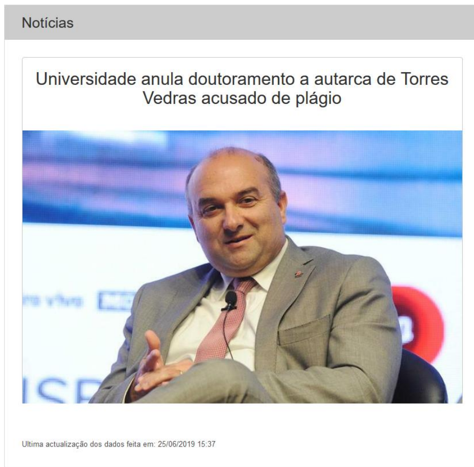
Figura 4. Notícias

As notícias no portal estão no menu Notícias na barra de menu, as notícias estão organizadas na forma de lista onde as notícias estão ordenadas pela mais atual até a menos atual.