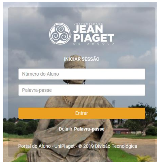
Figura 1 Login no Portal do Aluno

Para aceder o portal o aluno deve abrir o navegador web no computador ou smartphone e ir para o site www.unipiaget-angola.org/alunos , uma vez carregada a página web, o aluno deve escrever o Número do Aluno no formato “ V0012014 ” na primeira caixa de texto, a Palavra-passe na segunda caixa de texto e clicar no botão “Entrar”